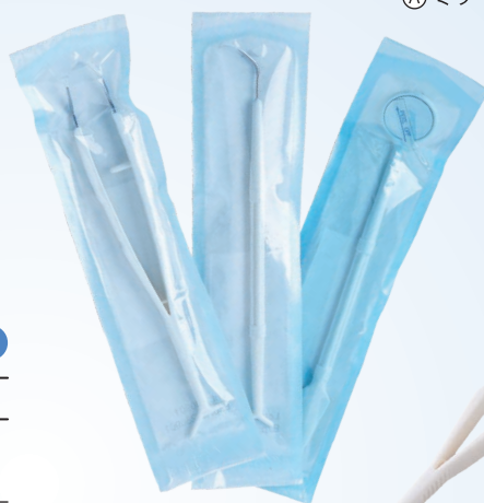
③ ピンセット ② エクスプローラー ① ミラー