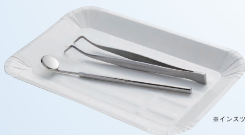
※インスツルメントは別売です。

販売名：滅菌済ディスポインスツルメント 一般医療機器 届出番号：27B2X00268X00098