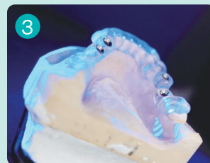
スキャンニング中