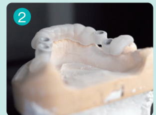
均一にスプレーした状態