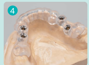
数時間後、完全に消えます

スキャンスプレー SCANTIST 3Dの動画をぜひご覧ください。コーティングが自然に消えていく様子を詳しく確認していただけます。