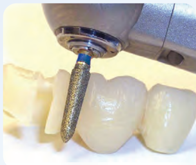
ジルコニアクラウンの分割撤去も短時間で行えます。