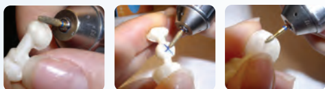
咬合面やマージン調整にも。