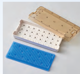
各ケースには専用のシリコンマットが1枚付属。