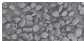
SEM画像250倍 Fraunhofer IGB研究所

新タイプの糖アルコールでプラークやバイオフィームはもちろん頑固なステインもやさしく除去します。