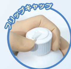
片手で開け閉めできる フリップキャップ仕様