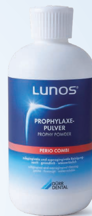
ナチュラル (無香料)

粒子サイズ約30 \mu m。歯肉縁上/縁下のバイオフィーム除去、軽いステイン除去にご使用いただけます。