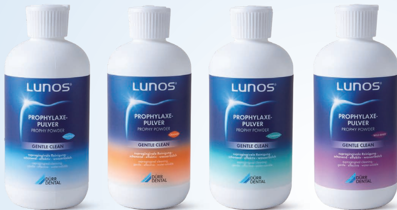
ナチュラル (無香料)

粒子サイズ約65 \mu m。歯肉縁上のステインとプラーク除去にご使用いただけます。補綴歯にも施術可能です。